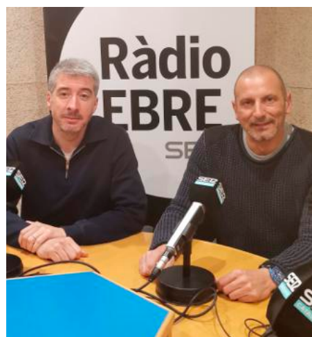
L'Associació Jeroni de Moragas de Mora d'Ebre