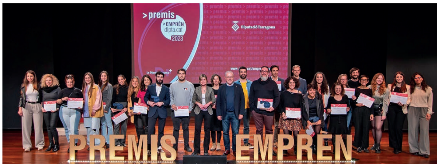
Foto de família del lliurament dels Premis Emprèn 2023.

Les sol·licituds per optar als guardons es poden presentar fins al proper 5 d'agost de 2024