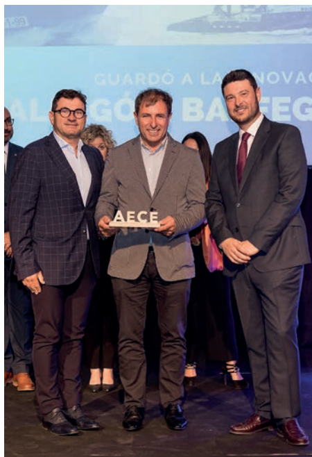
Guardó a la innovació Balfegó & Balfegó