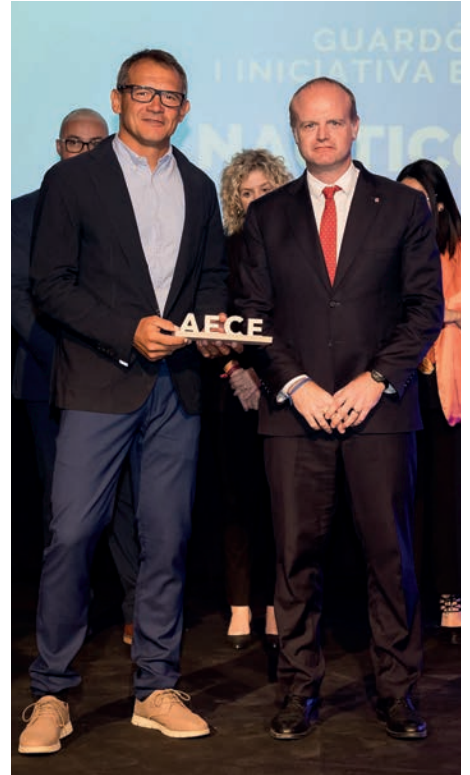
Guardó al turisme i iniciativa empresarial Nauticològic, SL