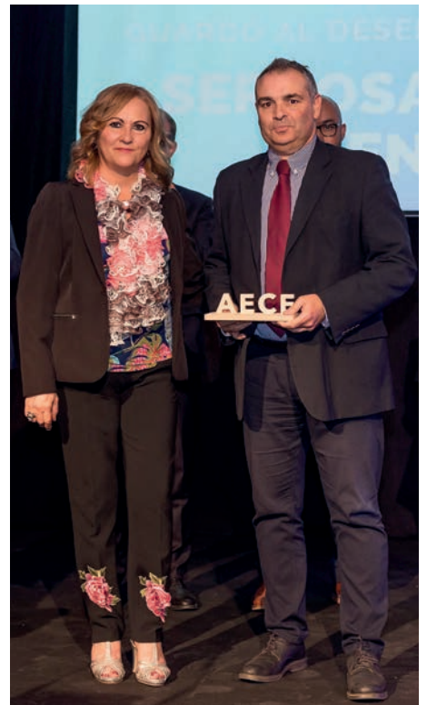
Guardó al desenvolupament sostenible Sercosa from Inversiones Energéticas, SL