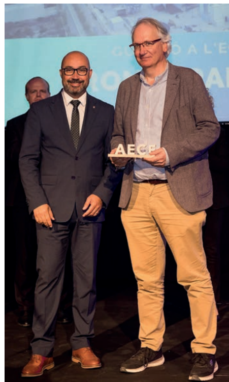
Guardó a l'economia circular Kronospan Tortosa, SLU