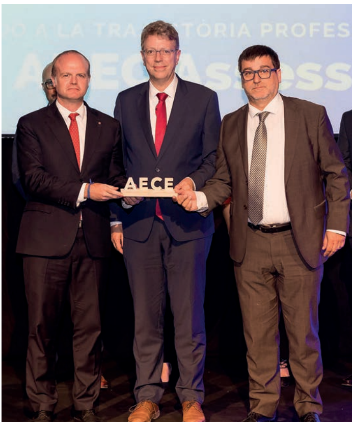
Guardó a la trajectòria professional Adec Assessors, SL