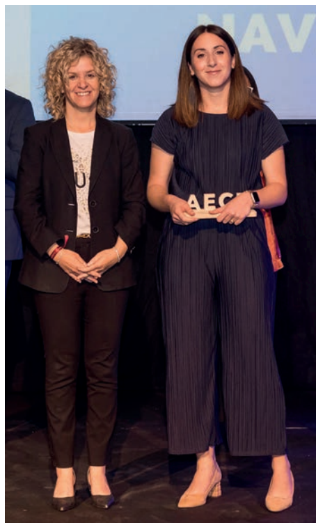
Guardó a la innovació Florette Hortícola Navarra