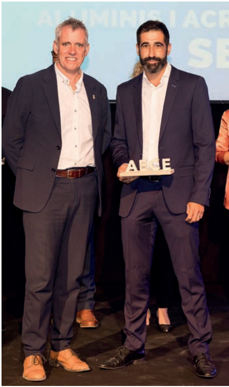
Guardó a la trajectòria empresarial Aluminis i Acristallats Sesé, SL