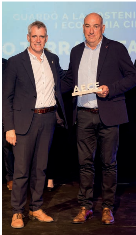
Guardó a la sostenibilitat i economia circular Eco Terra Alta, SL