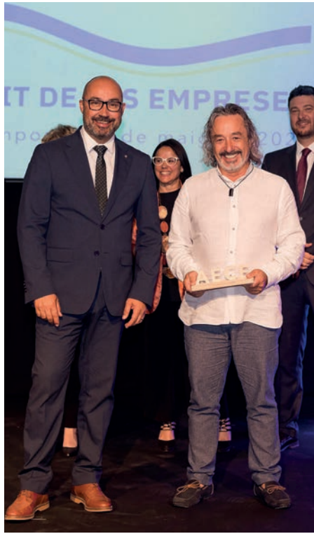
Guardó a la trajectòria empresarial Comfil