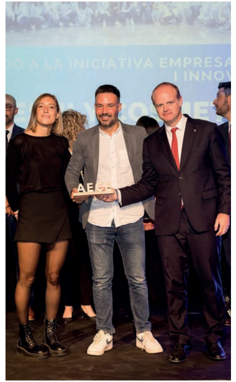
Guardó a la iniciativa empresarial i innovació Freshly Cosmetics