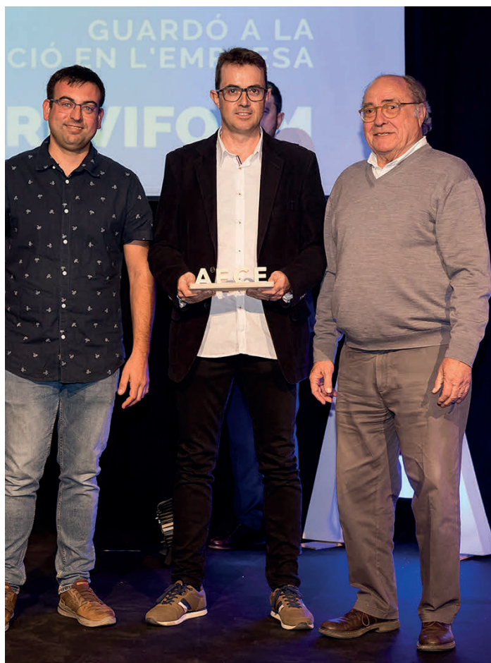
Guardó a la formació en l'empresa BRM Previform, SL