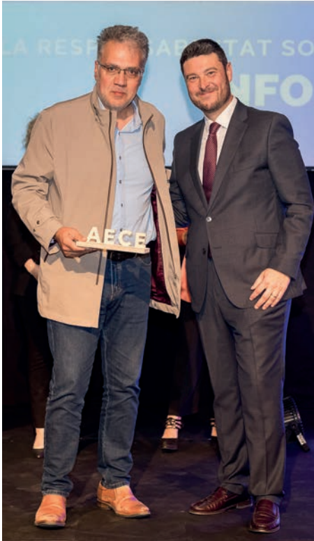
Guardó a la responsabilitat social Infosa