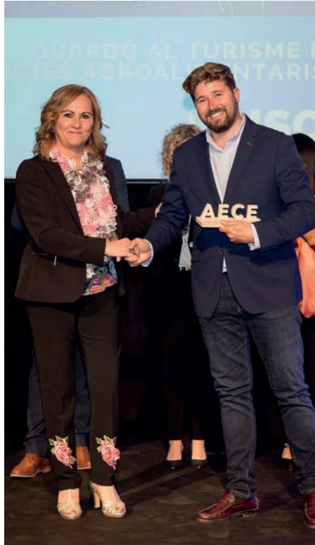
Guardó al turisme i promoció de productes agroalimentaris de qualitat Musclarium