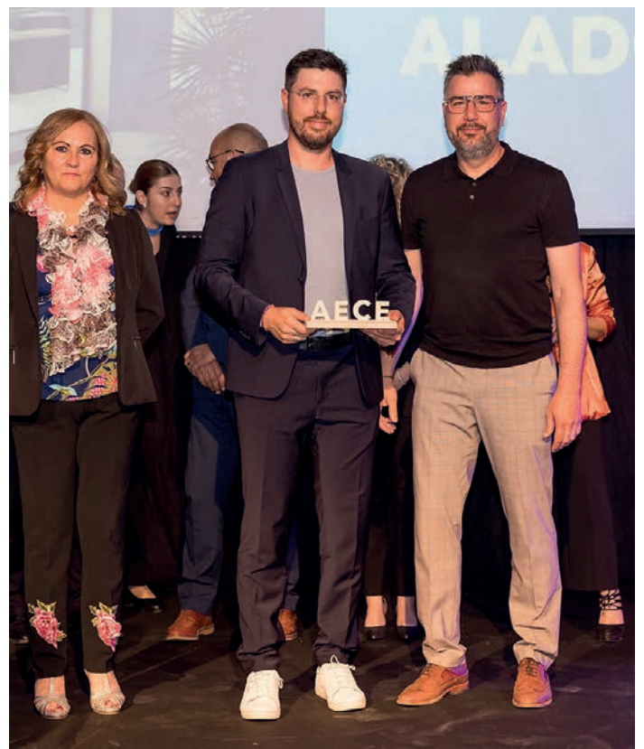
Guardó a la trajectòria empresarial Alado, SA