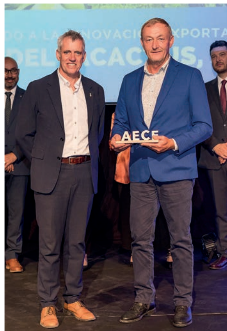
Guardó a la innovació i exportació Deltacactus, SL