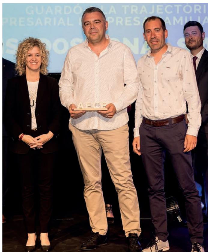
Guardó a la trajectòria empresarial i empresa familiar Pretensados Arnal, SA