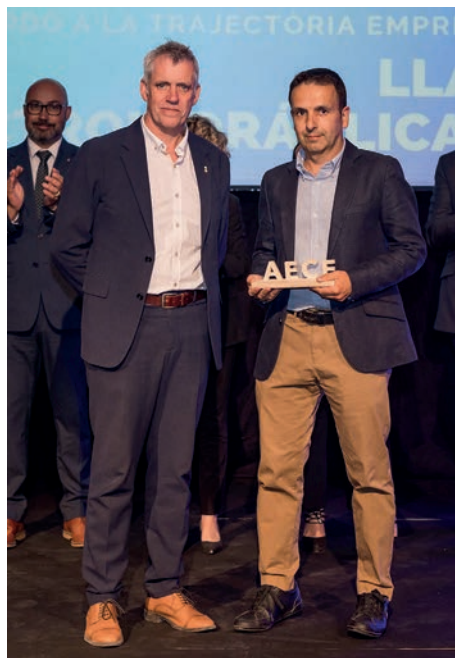
Guardó a la trajectòria empresarial Llatje Hidràulica, SL