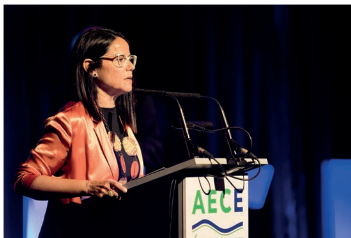
Intervenció de Cinta Pascual, vicepresidenta de Foment del Treball Nacional