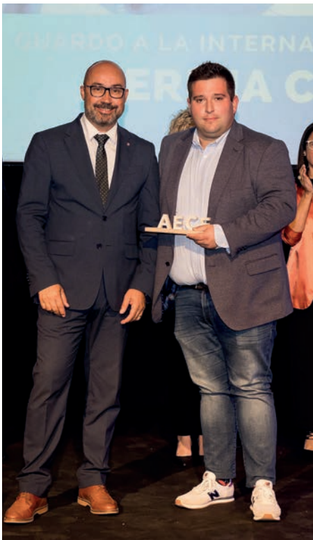
Guardó a la internacionalització CERIMA Cherries