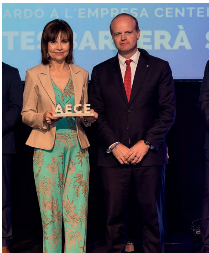
Guardó a l'empresa centenària Fruites Barberà, SL