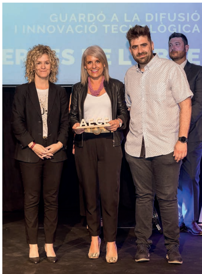
Guardó a la difusió de la innovació tecnològica Fablab Terres de l'Ebre