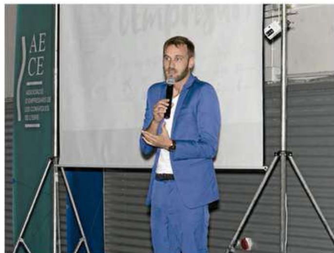
L'humorista Javi Princep.