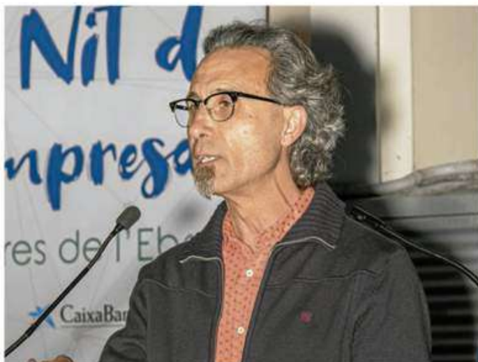
L'escriptor Vicent Pellicer.